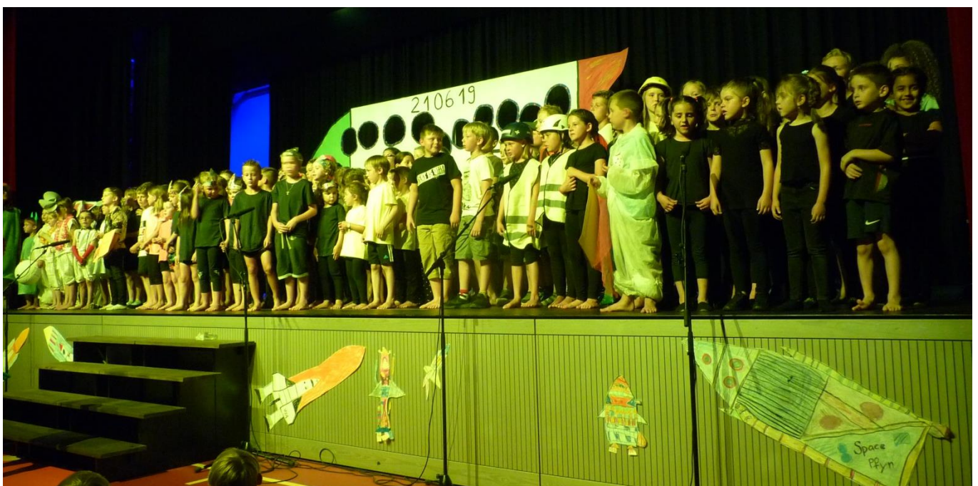
Schulschlussfest mit Einweihungsfeier der Mehrzweckhalle

Die Zustimmung zum Öffentlichkeitsgesetz an der Abstimmung vom 19. Mai 2019 wird Auswirkungen auf die Protokollführung der Schulbehörde haben. An Veranstaltungen von Verband TG Schulgemeinden und dem Amt für Volksschule werden wir uns das nötige Rüstzeug holen, um den Datenschutz und das Öffentlichkeitsprinzip unter einen Hut zu bringen.